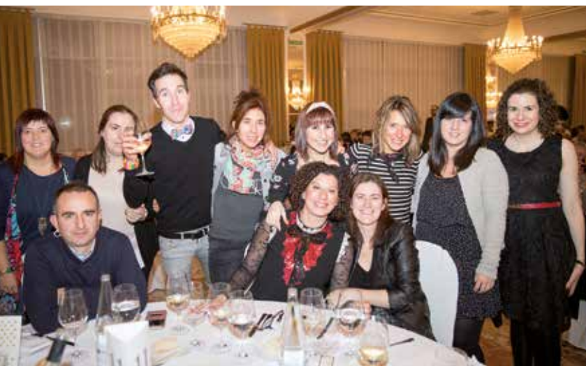
La Banda del desagüe amenizó la fiesta.