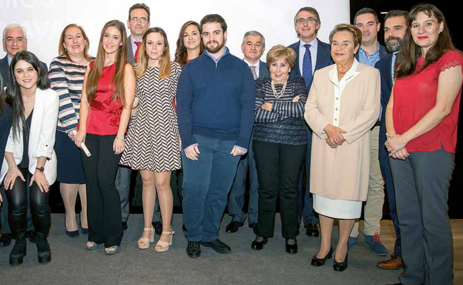
Autoridades, premiados y nuevos colegiados.