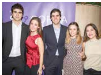
Algunos invitados y colegiados asistentes al acto.