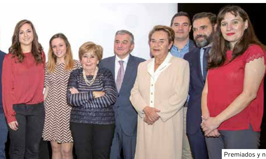
Premiados y nuevos colegiados.