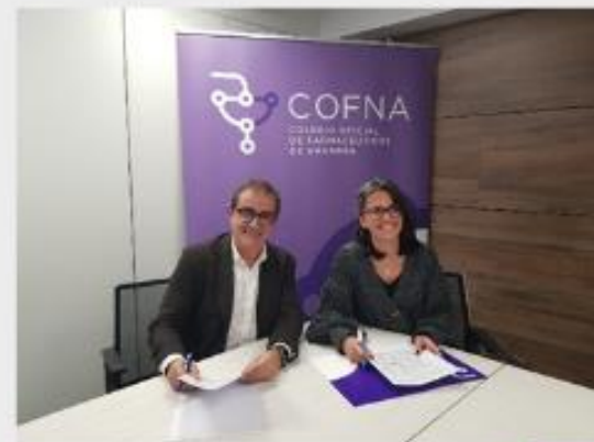
FIRMA CONVENIO ADHI

125 ANIVERSARIO DEL COFNA (SEMANA DEL 10 AL 17 NOVIEMBRE)