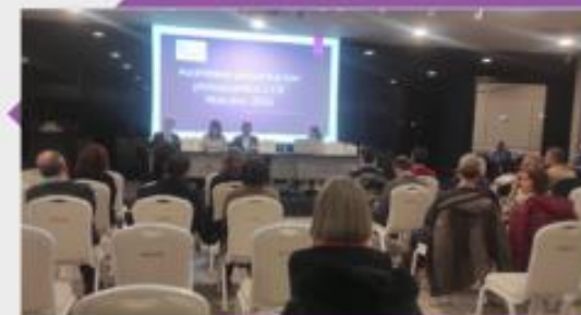
ASAMBLEA COLEGIADOS DIC23