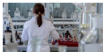
Prácticas de Laboratorio Verano